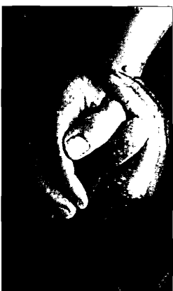
Applausi di beneficenza stasera a teatro

CERVIA - "Turisti per caos e la maledizione dell'anello non pescato": questa sera (ore 20,30), nel piazzale antistante la Torre San Michele, spettacolo dell'associazione culturale e di beneficenza Rumours for Children. Si parte alle 20, quando verrà servita paelia a tutti i partecipanti; poi, alle 20,30, è il turno dello special show di satira che ricorda l'ultima edizione "sfortunata" dello Sposalizio del Mare, ovvero quando i pescatori non sono riusciti a recuperare l'anello lanciato in mare dal Vescovo.