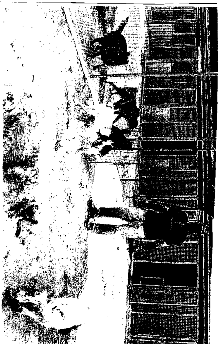
ONLUS Arca 2005 ha raccolto i fondi durante il Palio che ha ospitato anche la seguitissima gara tra cani da salvataggio